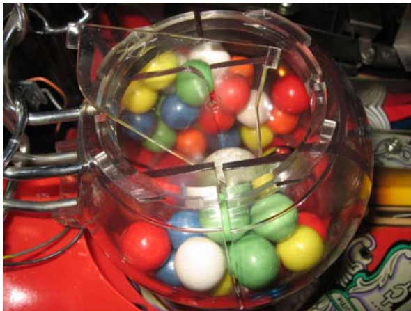
Das Plastik muss raus ...