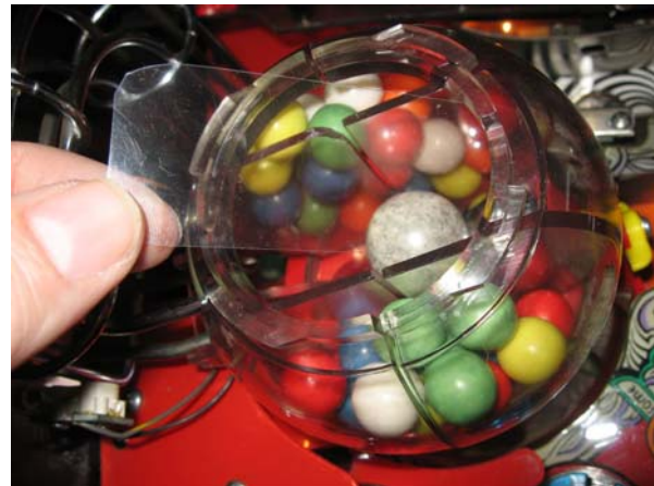
und das zugeschnittene kommt rein.

Das zugeschnittene Stück wird an den gekennzeichneten Stellen eingeklemmt. Es kann seine dann nicht mehr verändern. Die Länge der Folie bestimmt die Stärke der Biegung nach oben, und damit wie viel Platz die drei Kugeln zum durchrollen haben.